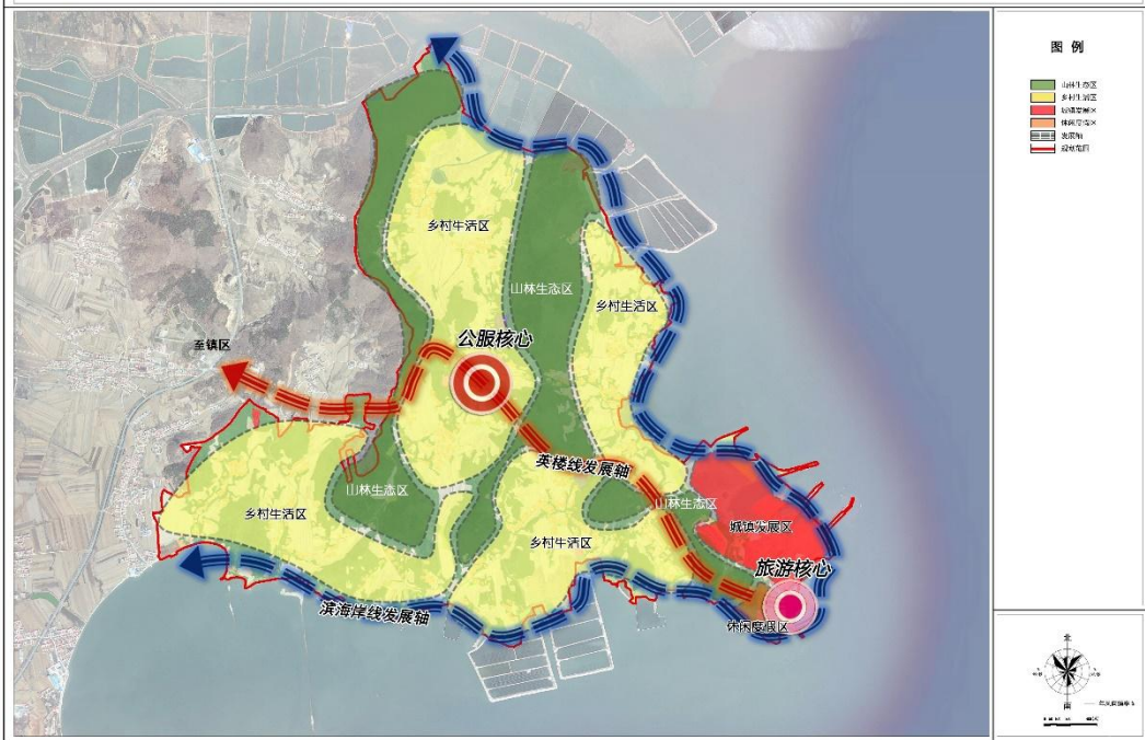
4. 村域国土空间规划图